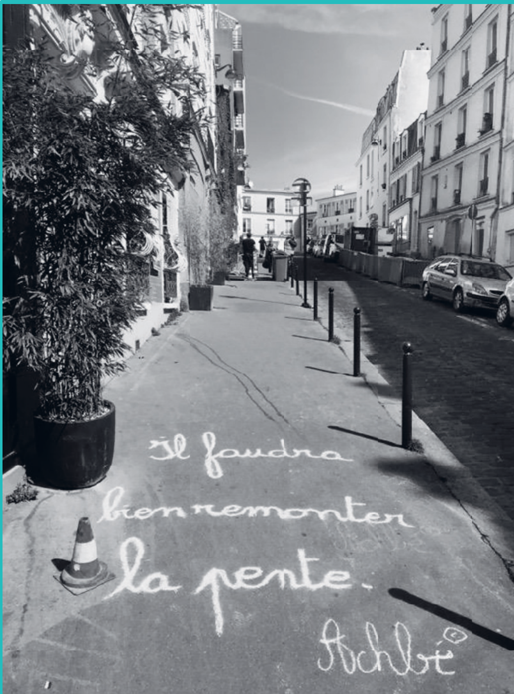
Ma rue par Achbé